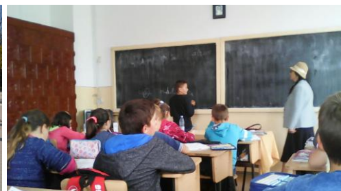
Consultanță în școli