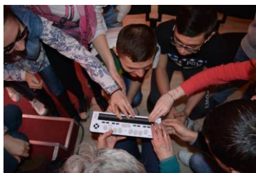
„Laptop” de braille