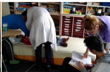
Consultanțe medicale și informare juridică