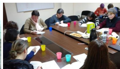
Grup de suport

În TG. Frumos avem colaborare cu Centrul Social Multifuncțional al primăriei. Beneficiarii incluși în serviciile noastre sunt persoane diagnosticate cu autism și familiile acestora. În 2016, ei au fost vizitați acasă pentru o evaluare, au avut loc vizite de consiliere la instituții de învățământ din Tg. Frumos și Comuna Strunga unde aceștia sunt înscriși, au mai fost organizate întâlniri de grup și evenimente de sensibilizare a publicului larg.