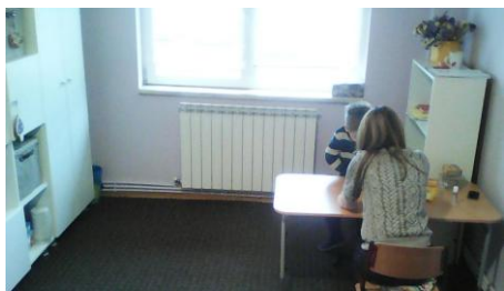
Cabinete psihologice Iași

În prezent, după un an de funcționare în acest mod, suntem bucuroși de rezultatele satisfăcătoare!