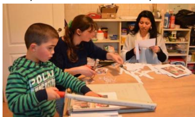
Activități de muncă adaptată