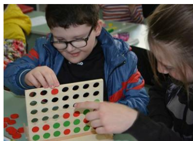
Activități de socializare

Din 2014 avem o fundație reprezentantă în Republica Moldova care funcționează cu un director executiv și un contabil. Cu specialiștii din România, Olanda și uneori din Marea Britanie, oferim cursuri, workshop-uri și conferințe cu tematica privind Tulburările din Spectrul Autist, învățământ pentru elevi cu Cerințele Educaționale Speciale, consiliere pentru părinții copiilor cu nevoi speciale și întâlniri cu activități de integrare socială pentru acești copii. În aceste activități colaborăm cu instituții de stat și organizații de părinți.