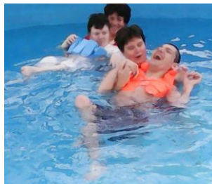
Bucurie în piscina acoperită, program cu voluntari din SUA