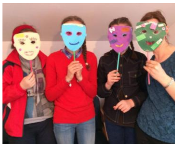
grup de adolescenți